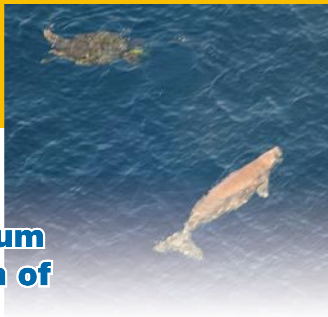
Okinawa Dugong 沖縄のジュゴン

ジュゴンが生息するすべての国は、ジュゴンへの影響を最小限にすること、CMSの「ジュゴン生息域すべてにおけるジュゴンの保護と管理のための覚え書き」に参加すること