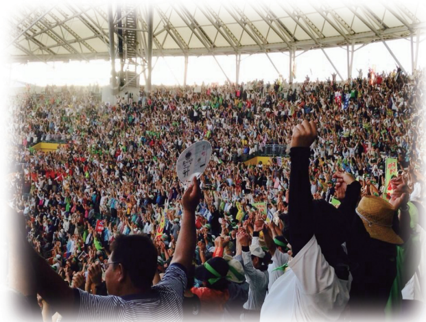
昨年11月1日 沖縄セルラースタジアムの「うまんちゅ1万人大集会」