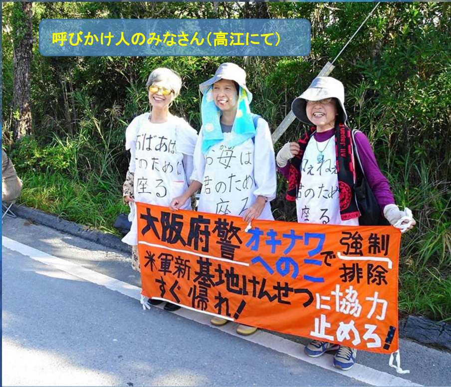
呼びかけ人のみなさん(高江にて)

大阪府警 オキナワ 強制排除 米軍新基地への協力 すぐ帰れ! 大阪府警 オキナワ 強制排除 米軍新基地への協力 すぐ帰れ!