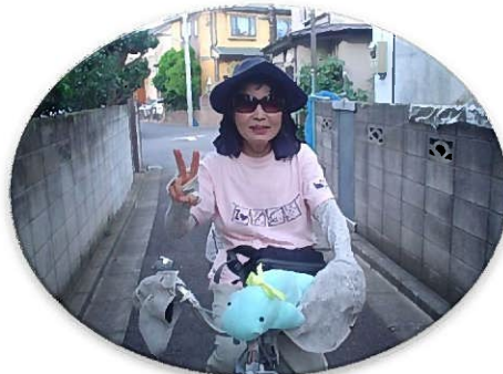
自転車の前カゴにジュゴンが！

全国からお寄せいただいた、写真とメッセージを、web上で公開したいと思います。ぜひ、 info@sdcc.jp まで送ってください。