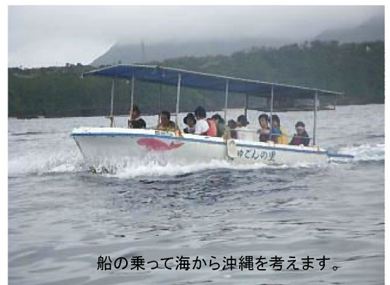
船の乗って海から沖縄を考えます。

※ツアー費用内訳：飛行機・宿泊2泊・船・レンタカー・ガイド料・保険・食事(1日目の夕食～3日目の昼食まで)